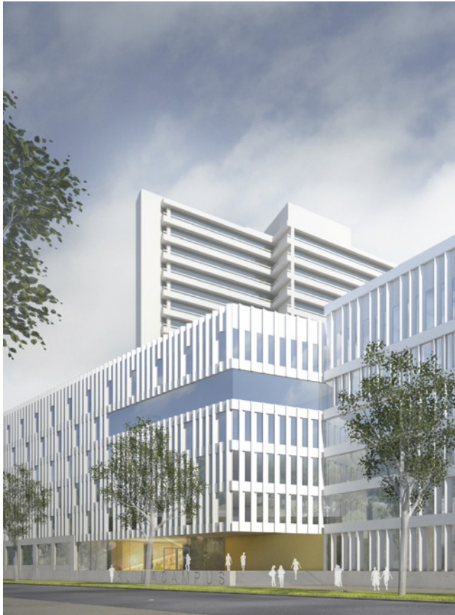
Blick vom Bahnhof Schlump