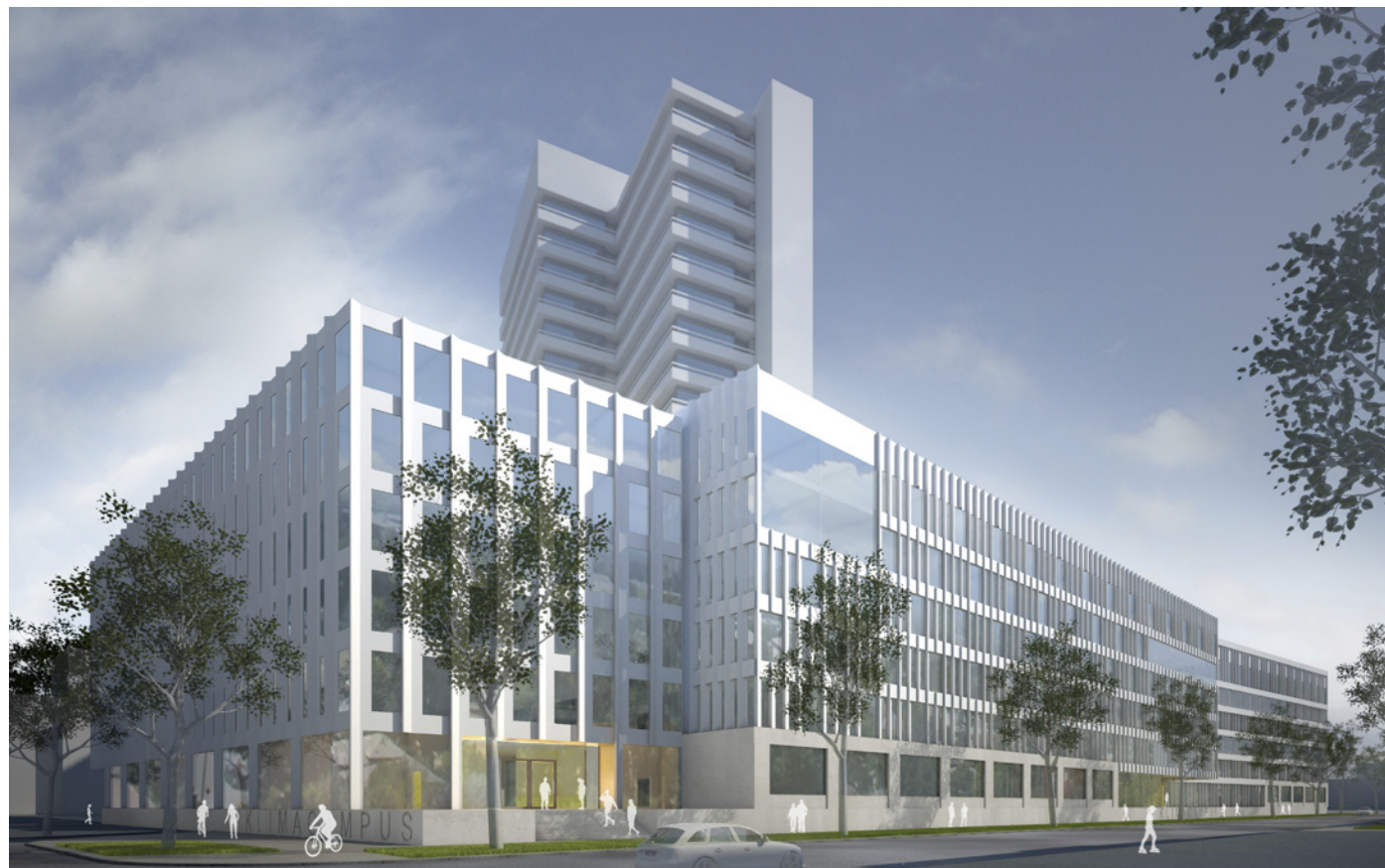
Ansicht von Kreuzung Bundesstraße / Beim Schlump