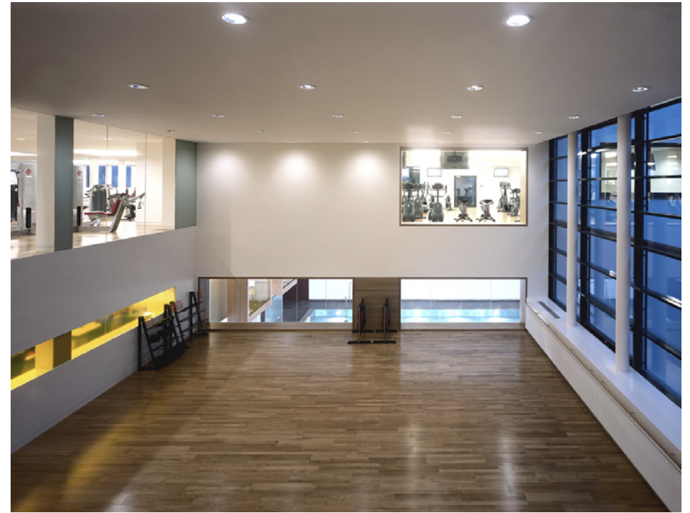
Main Studio in Gymebene