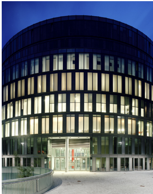
Blick vom Innenhof

Der Holmes Place Club in Köln hat eine Fläche von über 5.200 m 2 und befindet sich im Mediapark in einem von fünf kreissegmentförmigen Gebäudeeinheiten, die einen gemeinsamen Innenhof umschließen. Der Club erstreckt sich über 5 Ebenen.