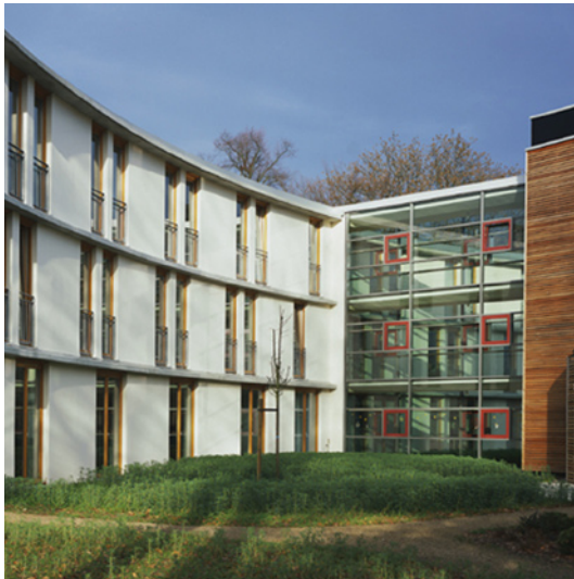
Verbindungsflur zum Wohnflügel