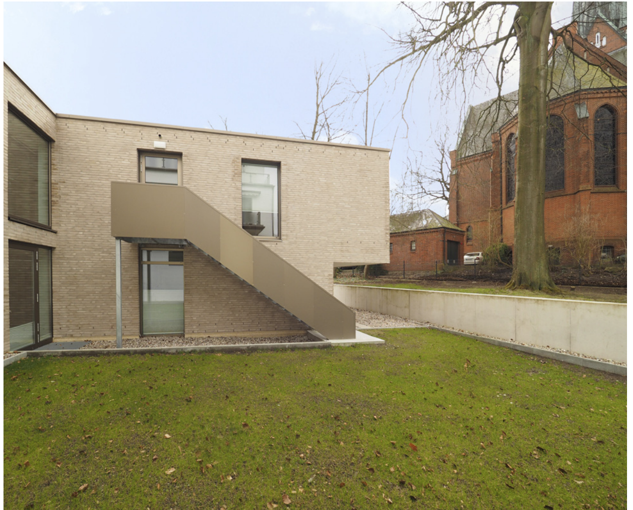
Gebäudebezug zur Kirche