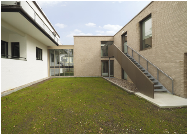
Westansicht Verbindung Alt und Neu