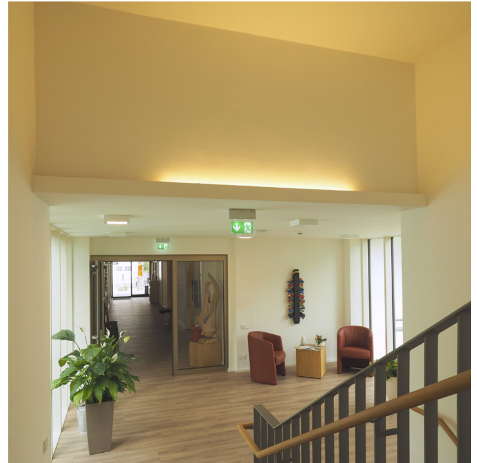
Blick zum Hauptflur