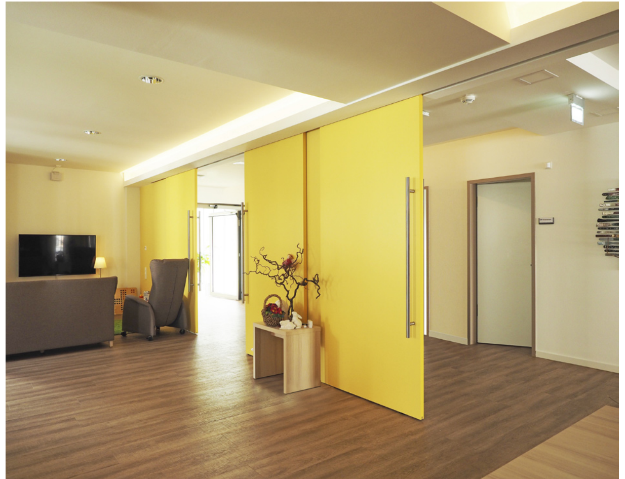
Mehrzweckraum mit Flurverbindung