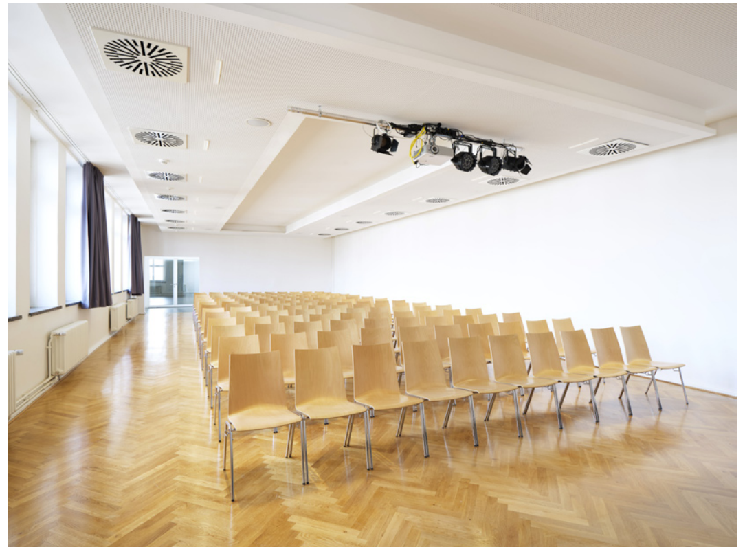
Aula im 3. Obergeschoss