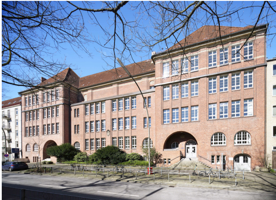
Straßenfassade, bereichsweise Fugensanierung

Das Gebäude der Marie-Beschütz-Schule aus dem Jahre 1908-1910 wurde bis zu unserer Sanierung als Grundschule genutzt. Für die Stadtteilschule Eppendorf, deren Oberstufe ab 2020 das Haus mit Leben füllen wird, waren verschiedene Maßnahmen notwendig: Neben der Herstellung der Barrierefreiheit sowie des baulichen Brandschutzes wurden eine kleine Aula sowie Fachräume für Naturwissenschaften, Informatik und Bildende Kunst hergestellt. Neben neuen WCs auf allen Geschossen wurde die gesamte Haustechnik auf neuesten Stand gebracht: Sanitär-, Lüftungs- und Elektroinstallation sowie Datentechnik und Hausalarmanlage wurden komplett erneuert, die Heizungsanlage ertüchtigt.