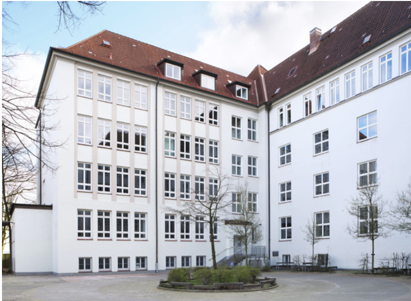
Schulhoffassade nach Sanierung