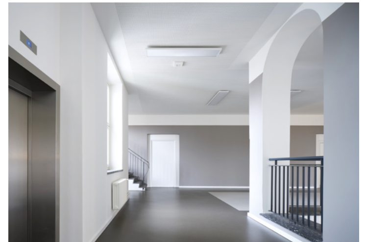
Flurbereiche Treppe und Aufzug