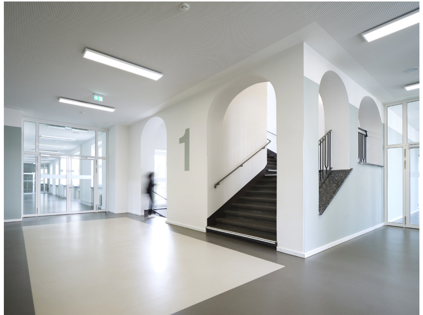
Entrée im Erdgeschoss