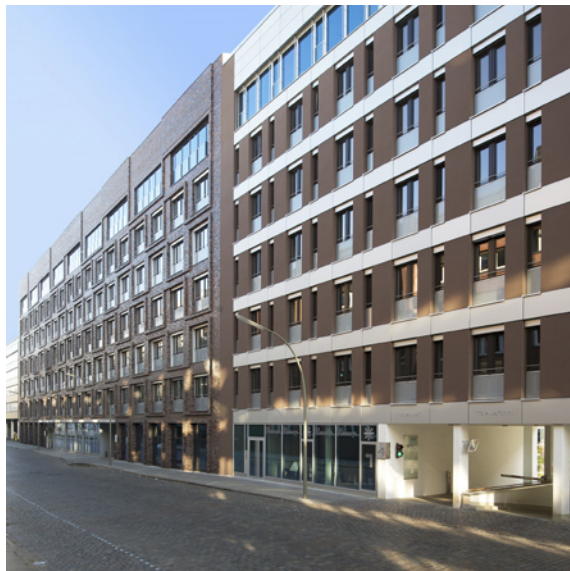
Ansicht von der Sachsenstraße

Durch einen weiteren nordwestlichen Gebäudeteil an der Sachsenstraße entsteht ein zweiter Innenhof der für oberirdische Besucherstellplätze und die Anordnung der Müllräume vorgesehen ist. Rückseitig schließt das Gebäude an den bestehenden Südkanal an.