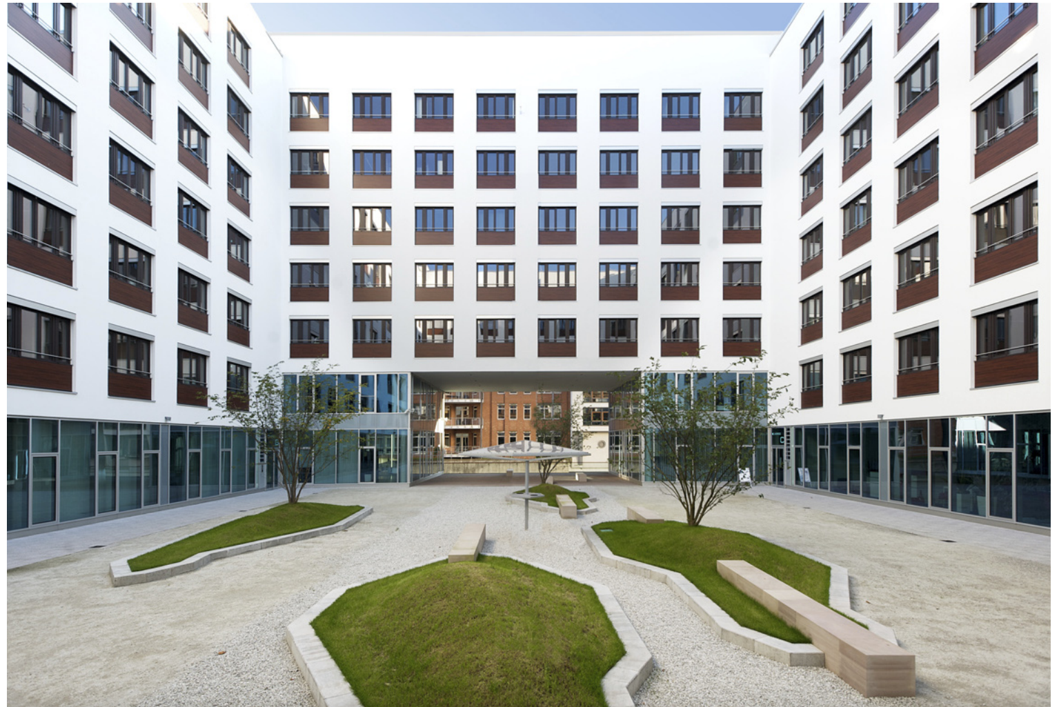
Blick in den Innenhof