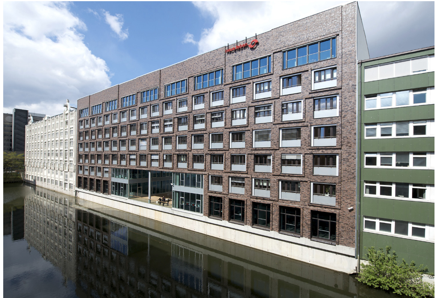
Ansicht Bauteil 1 vom Südkanal